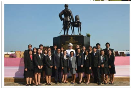
ชาว มมส ร่วมกิจกรรม 5 ธันวาคมหาราช 2554