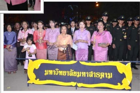
ชาว มมส ร่วมงานรัฐพิธี มหาราช