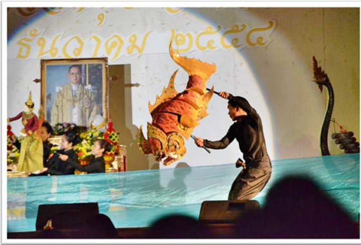
เยาวชนดีเด่นด้านศิลปวัฒนธรรม จำนวน 60 คน

วันที่ 8-11 ธันวาคม 2554 กองกิจการนิสิต นำคณะนิสิต คณาจารย์และบุคลากร มหาวิทยาลัยมหาสารคาม เข้าร่วมงานศิลปวัฒนธรรมอุดมศึกษา ครั้งที่ 12 “เทิดไท้องค์เอกอัครศิลปิน งานส่งเสริมศิลปวัฒนธรรมอุดมศึกษา ครั้งที่ 12” ณ มหาวิทยาลัยวงษ์ชวลิตกุล จังหวัดนครราชสีมา มหาวิทยาลัยมหาสารคามได้นำชุดการแสดงจำนวน 2 ชุด เข้าร่วมครั้งนี้คือชุดฟ้อนช่อหยาด และฟ้อนเกี่ยวสาวลงแก่ง จากนิสิตคณะศิลปกรรมศาสตร์ วิทยาลัยดุริยางคศิลป์และนิสิตโครงการส่งเสริม